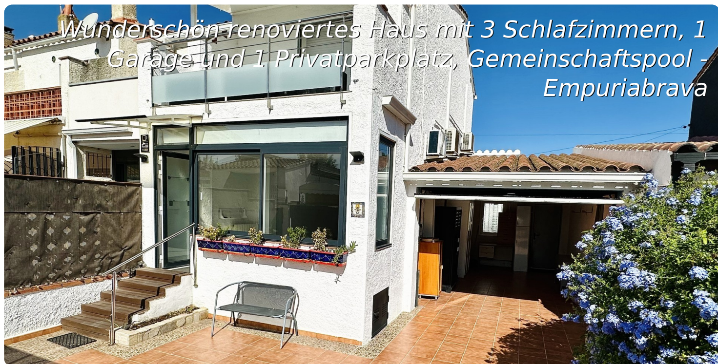
Wunderschön renoviertes Haus mit 3 Schlafzimmern, 1 Garage und 1 Privatparkplatz, Gemeinschaftspool - Empuriabrava