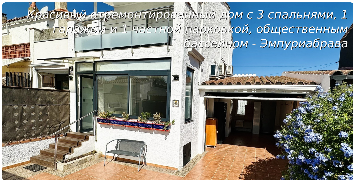
Красивый отремонтированный дом с 3 спальнями, 1 гаражом и 1 частной парковкой, общественным бассейном - Эмпуриабрава